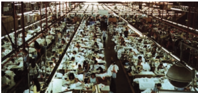
Maquila-Fabrik Chi Fung: Extremer Arbeitsdruck, erzwungene Überstunden und dreieckiges Trinkwasser

» Unternehmen, die Ausbildungsplätze stellen und die Gleichstellung von Frauen und Männern fördern, bevorzugt werden.