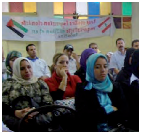
Internationaler Austausch von Arbeiterinnen (Tanger, vom 10 bis 15 Februar 2011)